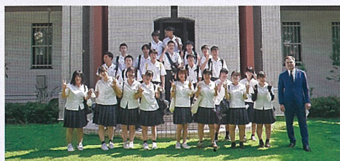
大阪ロシア領事館