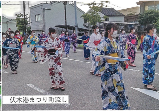
伏木港まつり町流し