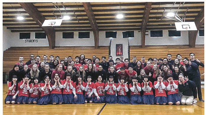
アメリカ語学研修