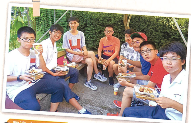
歓迎バーベキュー