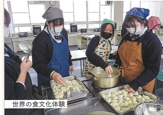
世界の食文化体験