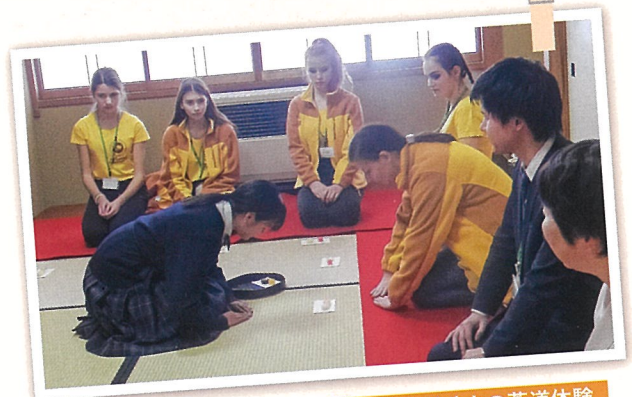
ロシア高校生との茶道体験