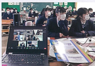
韓国高校生とオンラインで交流

韓国・中国・ロシアの 友好校の高校生たちと オンラインで交流し、 友情を深めました。