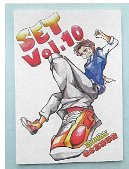
SET Textbook Vol.10