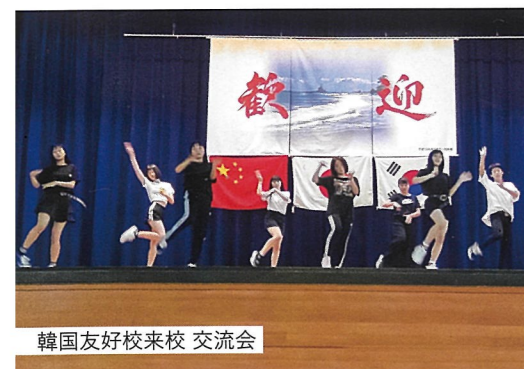
韓国友好校来校 交流会