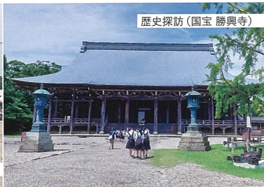
歴史探訪(国宝 勝興寺)